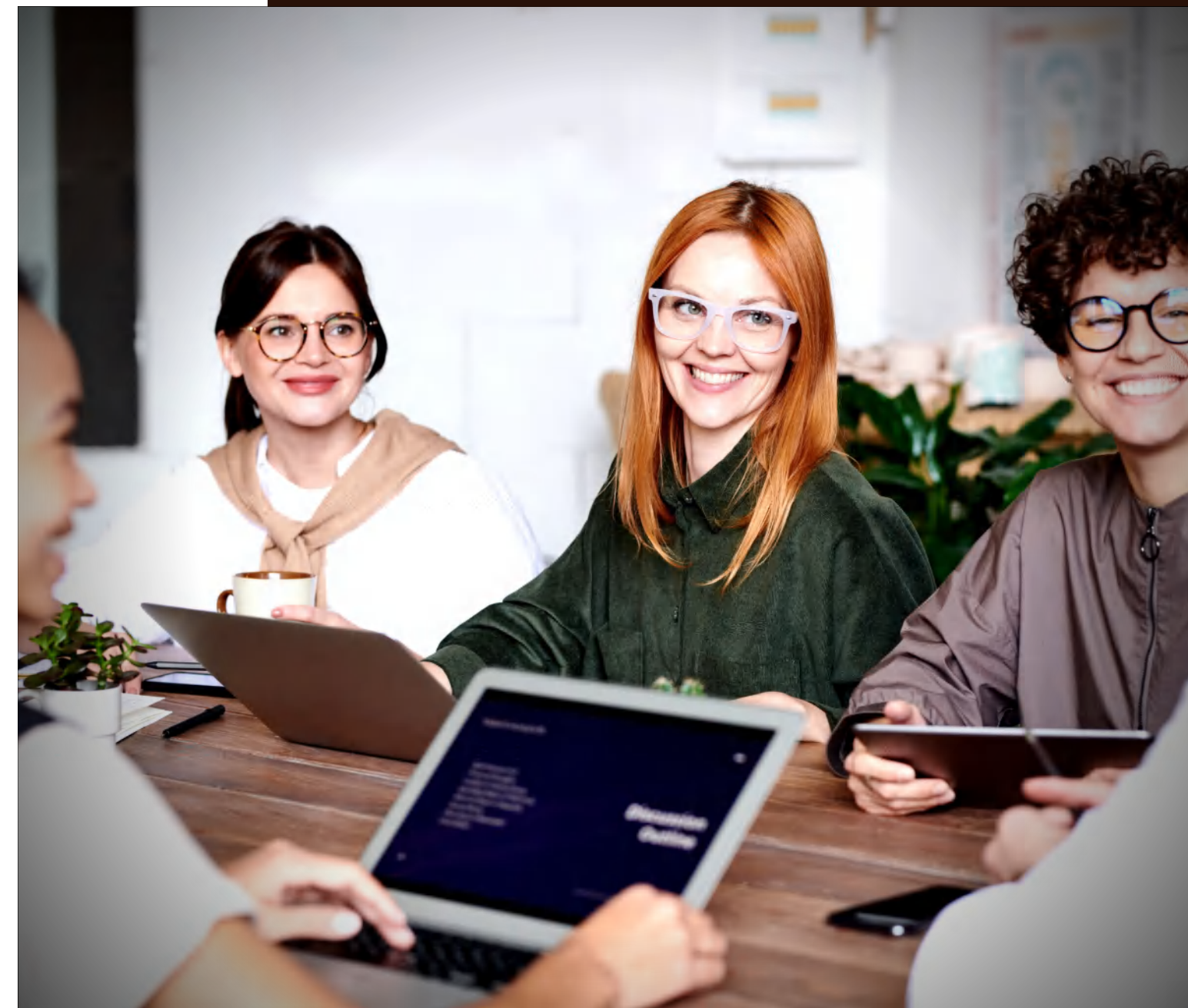
TABELA DE SERVIÇOS